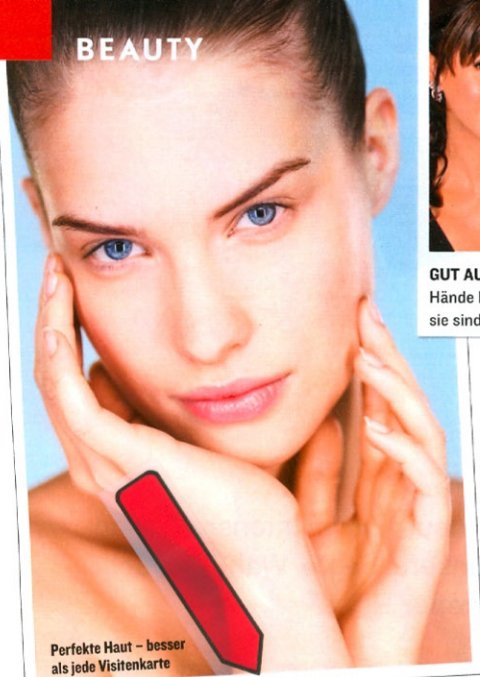
Perfekte Haut – besser als jede Visitenkarte