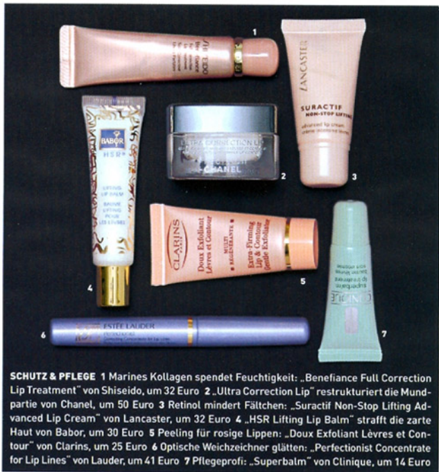
SCHUTZ & PFLEGE 1 Marines Kollagen spendet Feuchtigkeit: „Benefiance Full Correction Lip Treatment“ von Shiseido, um 32 Euro 2 „Ultra Correction Lip“ restrukturiert die Mundpartie von Chanel, um 50 Euro 3 Retinol mindert Fältchen: „Suractif Non-Stop Lifting Advanced Lip Cream“ von Lancaster, um 32 Euro 4 „HSR Lip Cream“ strafft die zarte Haut von Babor, um 30 Euro 5 Peeling für rosige Lippen: „Doux Exfoliant Lèvres et Contour“ von Clarins, um 25 Euro 6 Optische Weichzeichner glätten: „Perfectionist Concentrate for Lip Lines“ von Lauder, um 41 Euro 7 Pflegeprofi: „Superbalm“ von Clinique, um 14 Euro